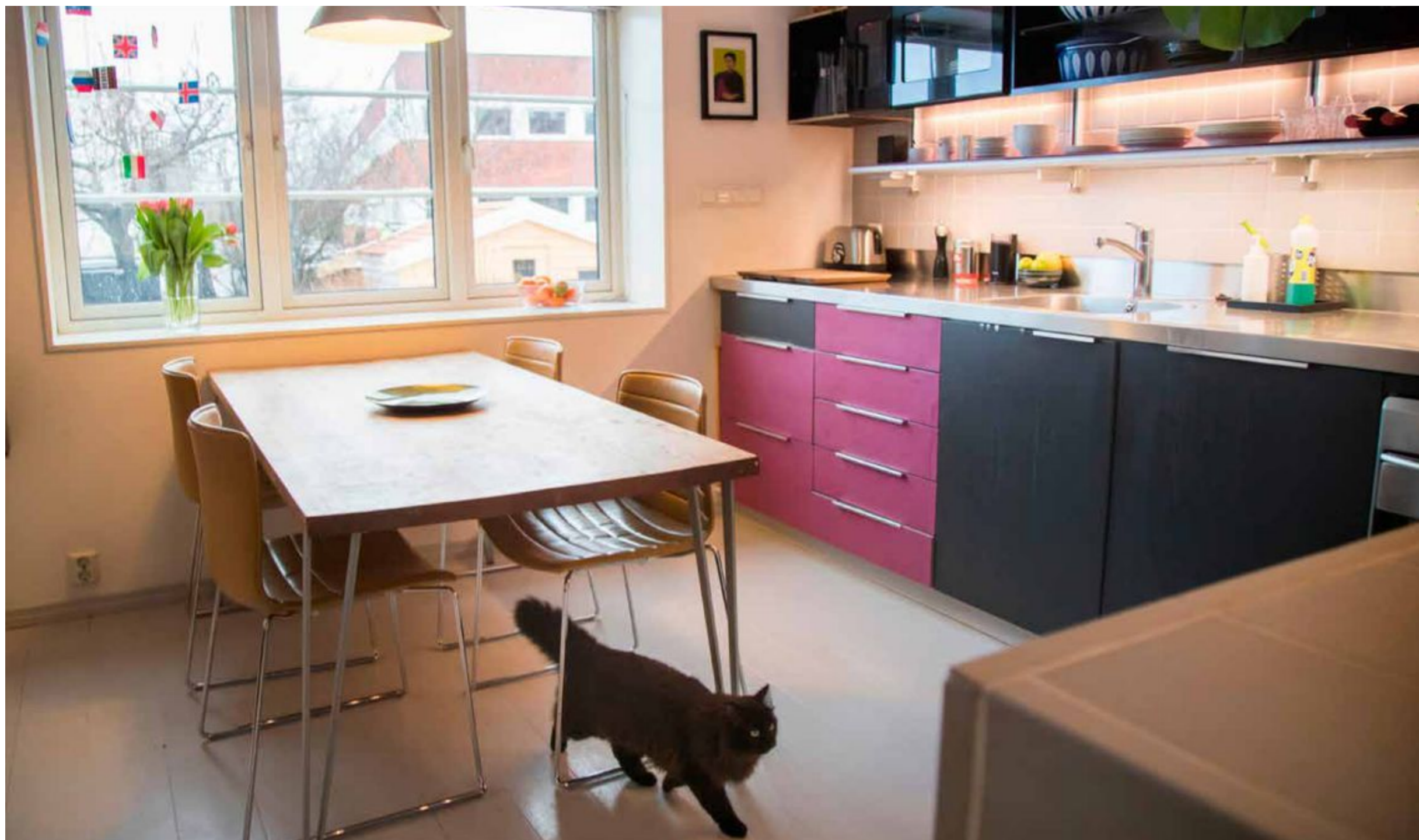
– Vi har gjort noen bevisste valg, og skal ikke gjøre noe mer.