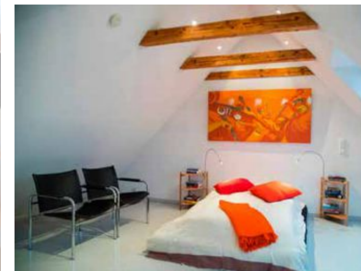
Loftet ble åpnet opp, og her har paret soverom i hele etasjen. De fikk lov til å sette inn to takvinduer, så lystilgangen er god.