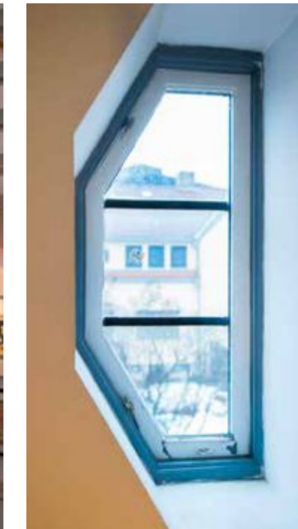
Et halvt vindu på et av soverommene.