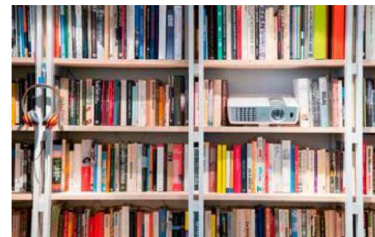
Nordahl laget selv en rimelig bokhylle langs den ene veggen i kjelleren. – Dette kan alle gjøre, mener han.