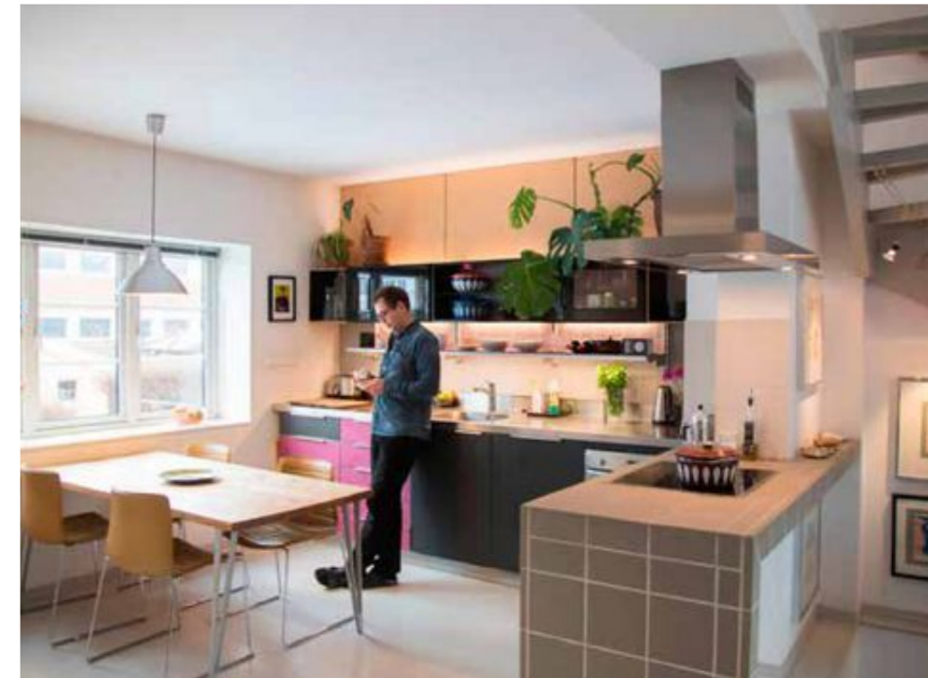
Den gamle veggen mellom kjøkken og stue ble revet. Nå kommer lyset inn fra begge sider.